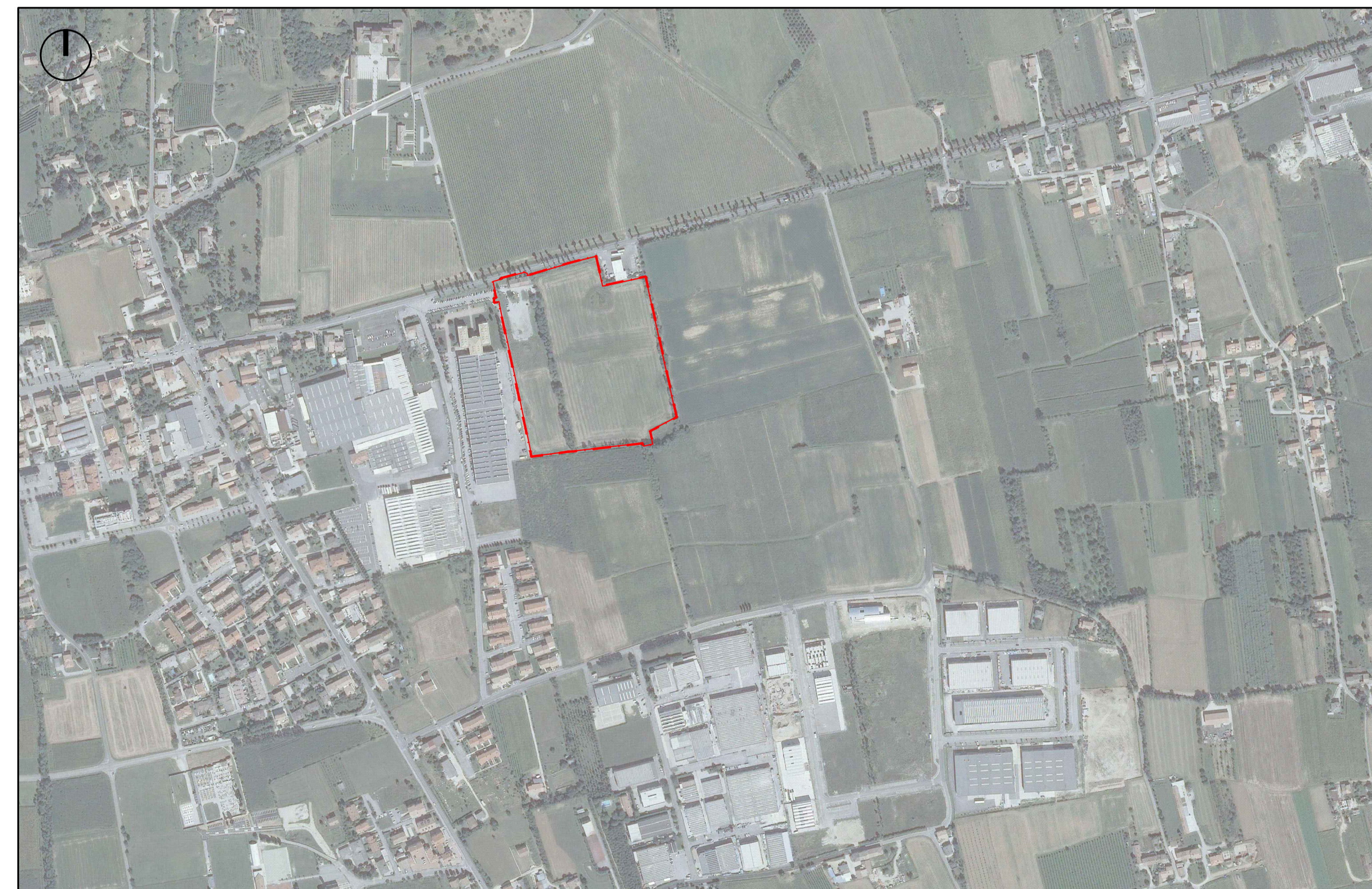
Ortofoto - Scala 1:5000