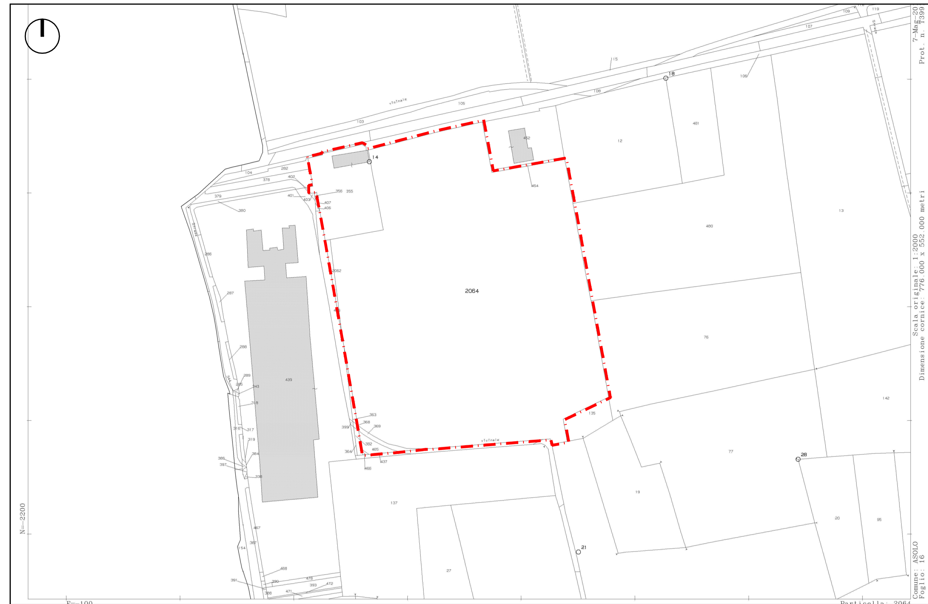
Estratto di mappa Comune di Asolo Fig. 16 - Scala 1:2000

"estratto mappa, CTR, PRG, Ortofoto dell'area interessata all'accordo"